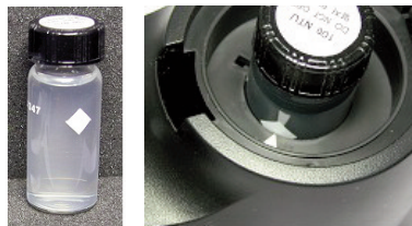
Sensor Trübung, P4251-2T (CMA: BT88i) - Seite 4

sensor. Richten Sie die Markierungen auf Küvette und Sensor aneinander aus. Schließen Sie den Deckel des Sensors.